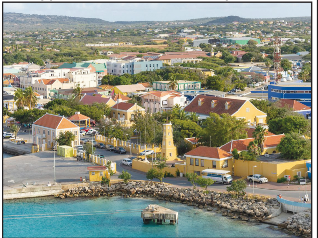
Un bunita foto aéreo di Kralendijk ku a sali den e artikulo di CNN-Travel.

Mas aleu CNN a publiká ku Boneiru ta mas ku solamente i destinashon di buseo. Naturalesa di e isla ta bunita, hendenan ta amabel i tin hopi atrakshon.